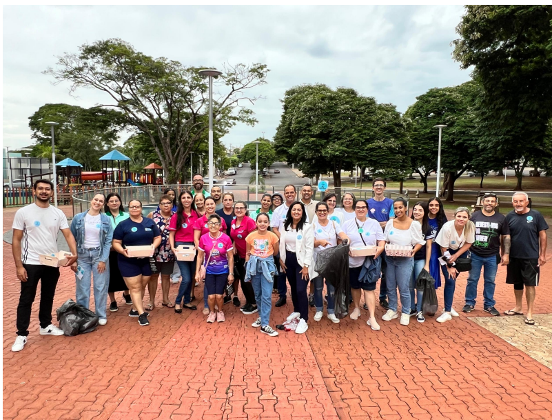
Imagem 4 - Paradinha “Cidade Limpa” - com Apoios de entidades (Polícia Civil, Polícia Penal, Guarda Municipal, Câmara de Vereadores, ACEI, Provopar, Comitê Mulher Sicredi, Grupo da Melhor Idade) - 04/2025.