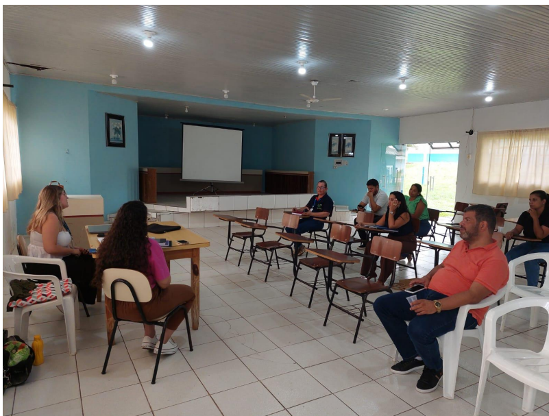
Imagem 2 - Primeira reunião do Grupo Gestor