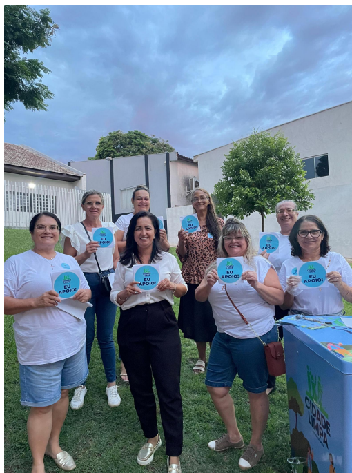
Imagem 9 - Retomada do Projeto Cidade Limpa/Comércio Limpo em parceria com ACEI (Associação Comercial) - 03/2025.