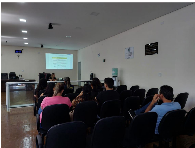
Imagem 3 - Segunda reunião do Grupo Gestor

O desenvolvimento do Programa Municipal de Educação Ambiental para Gestão de Resíduos Sólidos Urbanos (PMEARSU) no município de Iporã parte da análise da realidade local, considerando tanto a organização dos serviços relacionados à gestão dos resíduos sólidos quanto as ações de Educação Ambiental atualmente desenvolvidas