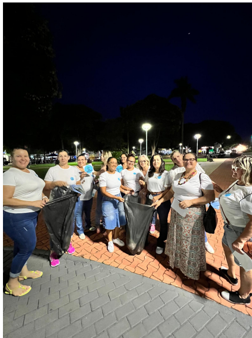
Imagem 8 - Retomada do Projeto Cidade Limpa/Comércio Limpo em parceria com ACEI (Associação Comercial) - 03/2025.