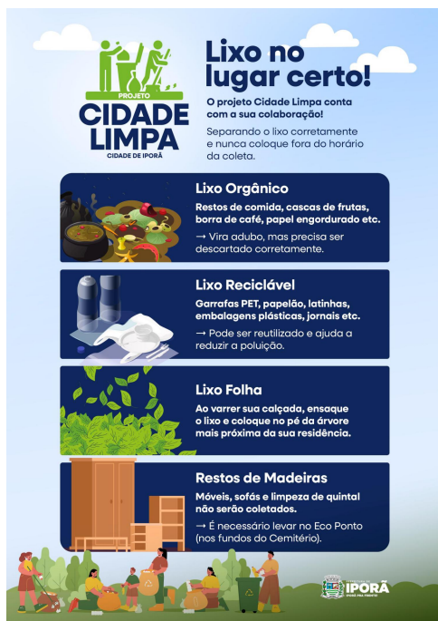
Imagem 6 - Arte do folder entregue a população