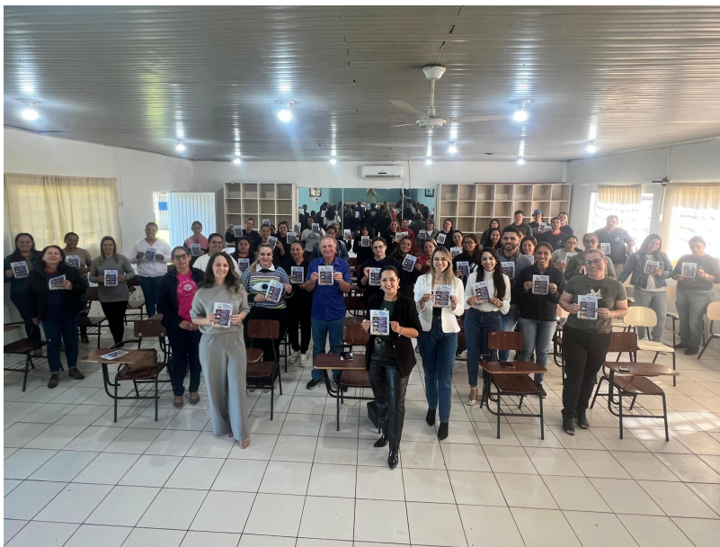
Imagem 5 - Ação - Separação do Lixo - Apoio da Sec de Saúde e Dep. de Vigilância Sanitária. 05/2025.