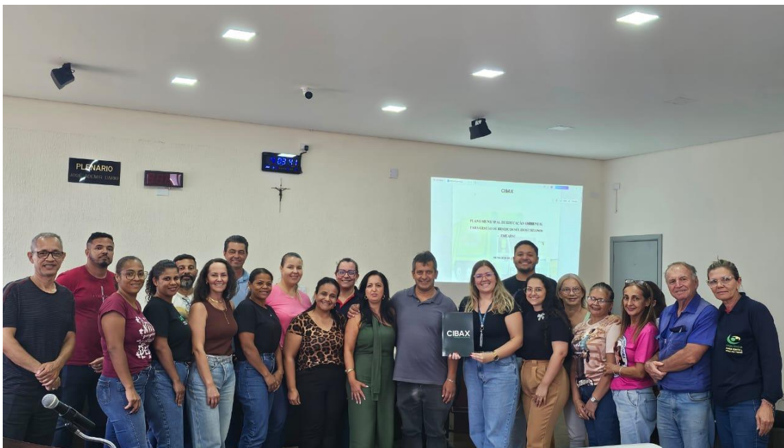
Imagem 10 - Entrega do PMEARSU

Essa etapa reforça a transparência do processo, promove o alinhamento institucional e fortalece o compromisso de execução do PMEARSU no Município de Iporã, garantindo que todos os atores envolvidos compreendam suas atribuições e a importância do desenvolvimento contínuo das ações de Educação Ambiental relacionadas à gestão de resíduos sólidos urbanos.