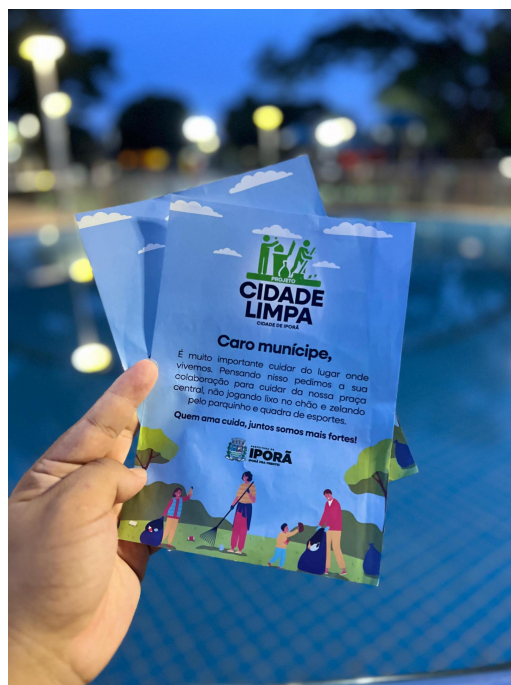
Imagem 7 - Aviso a população quanto ao descarte correto